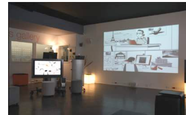
Business galery (univers immersif)