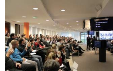
Orange Plaza (amphi 250 pl.)