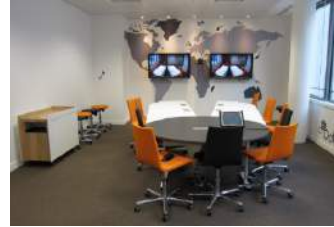
Orange Campus / Salle visio