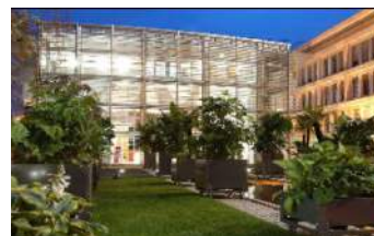
Issy les Moulineaux

Site pilote à Issy les Moulineaux et déploiement à l'international (San Francisco, Pékin, Varsovie, Londres) et en France (Grenoble, Lannion et Rennes)